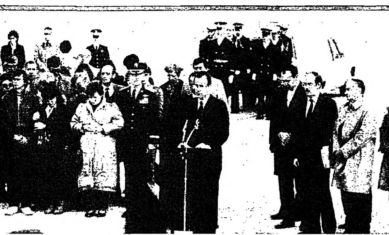
جورج بوش، بيلز، في القومية الأميركية في قاعدة اندروز